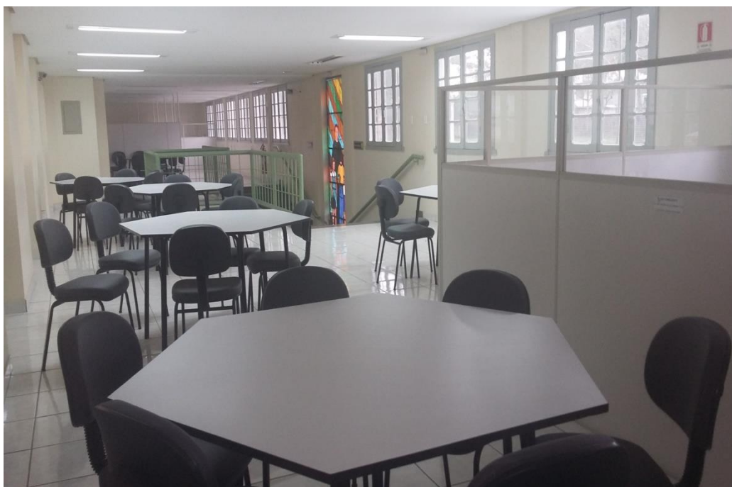
Figura 1 – Mezanino da biblioteca

Insira a Legenda “Figura” e acrescente o título da figura, conforme o exemplo a seguir. Insira a legenda “Fonte”. A fonte, mesmo que seja o (a) autor (a) do estudo, é elemento obrigatório. Use as mesmas configurações para quadros/tabelas, alterando o rótulo das legendas.