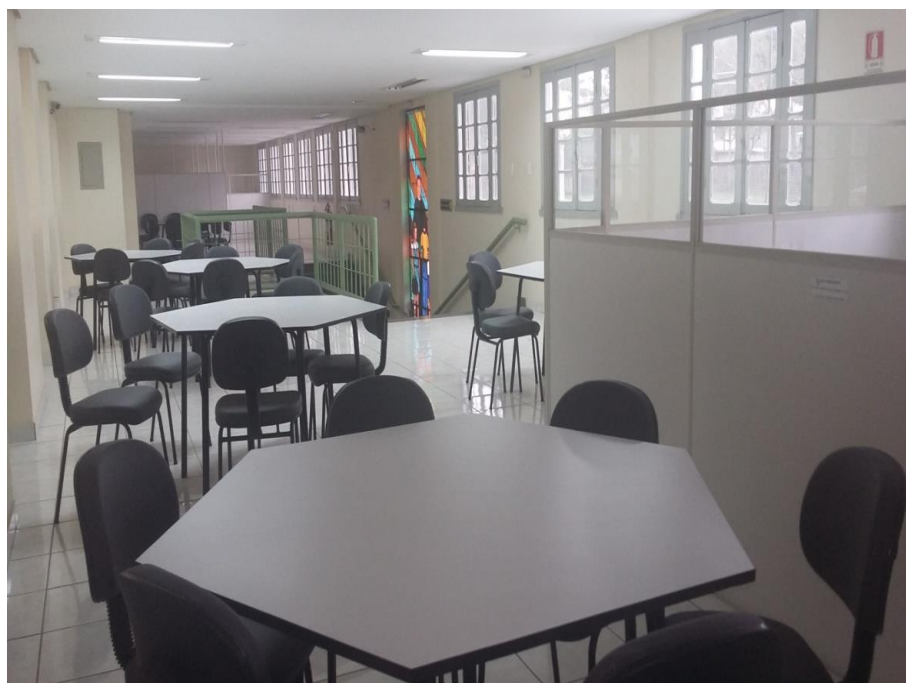
Figura 1 – Mezanino da biblioteca

Insira a Legenda “Figura” e acrescente o título da figura, conforme o exemplo a seguir. Insira a legenda “Fonte”. A fonte, mesmo que seja o (a) autor (a) do estudo, é elemento obrigatório.